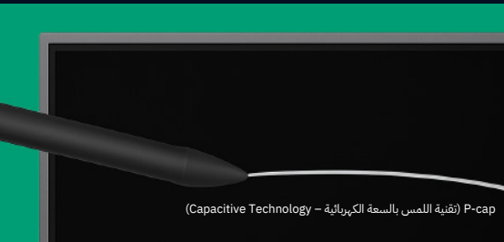
P-cap (تقنية اللمس بالسعة الكهربائية - Capacitive Technology)