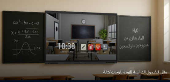
مثالي للفصول الدراسية المزودة بلوحات كتابة